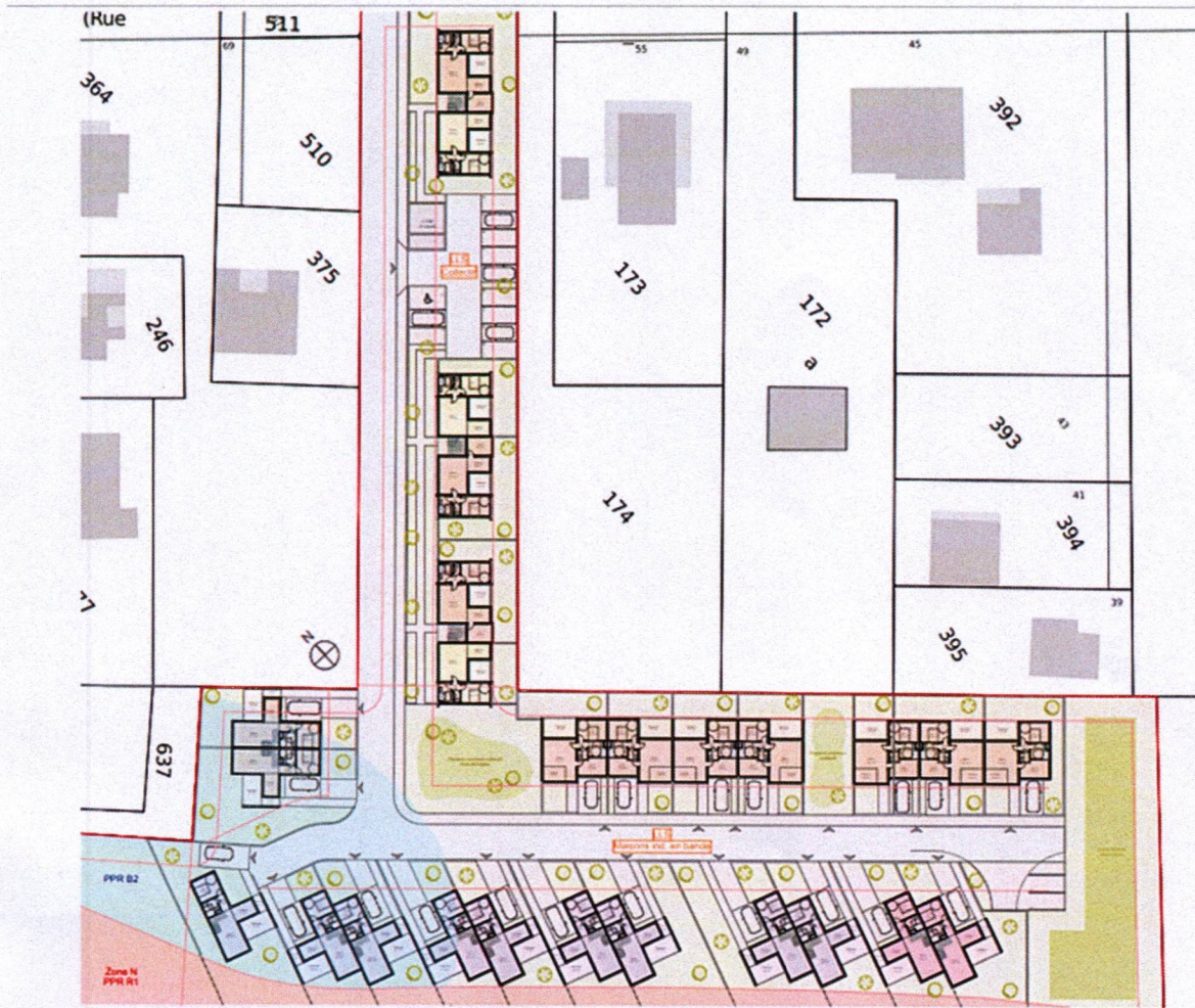
Vue d'ensemble du projet